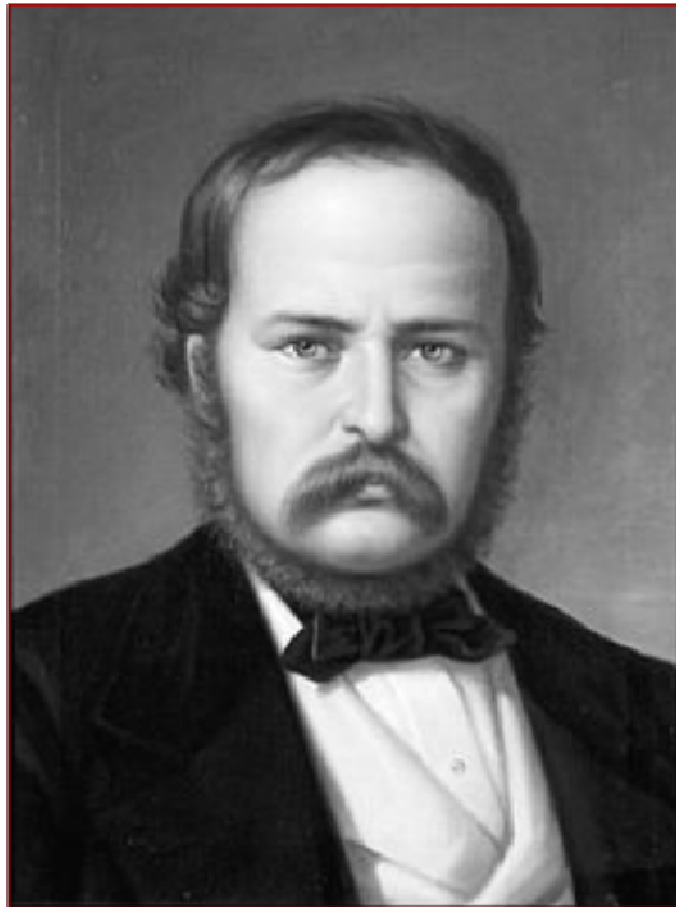
Andrei Mureșanu (portret pictat de Mișu Popp)