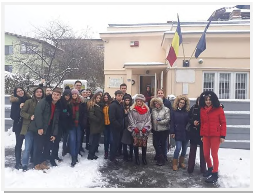
Liceul Teoretic „Ioan Petruș”, Otopeni Revistă școlară ROSE, nr.1 - Decembrie, 2018